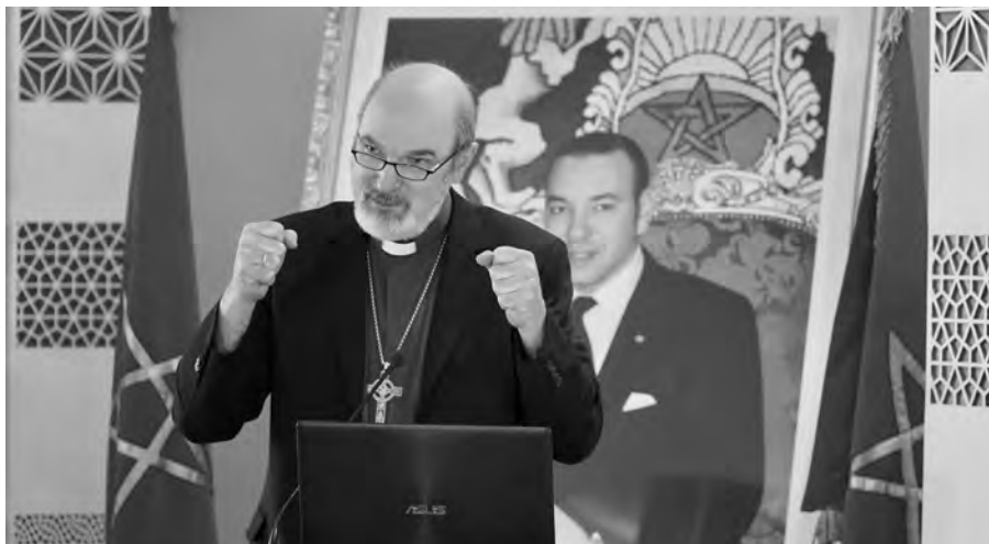
Thomas Schirmmacher während seiner Plenarversammlung in Rabat – hinter ihm das Foto des marokkanischen Königs © BQ/Warnecke.

Das IIRF stellte das Projekt jetzt auch der Öffentlichkeit vor – es steht den Medien nun als Download zur Verfügung. Der stellvertretende Generalsekretär der Weltweiten Evangelischen Allianz, der in diesem Netzwerk von 600 Millionen Protestanten unter anderem für den interreligiösen Dialog und das Eintreten für Religionsfreiheit verantwortlich ist, stellte diesen Plan (PDF)