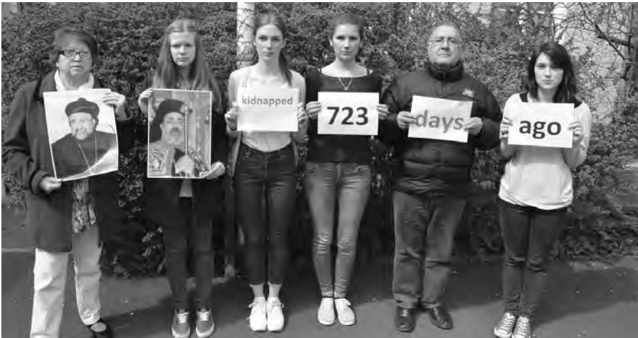
Am 16.04.2015 erinnerte die GfbV mit einer Mahnaktion an die entführten Bischöfe aus Aleppo. An diesem Tag waren sie bereits 723 Tage lang verschwunden.

In deutschen Städten und Gemeinden haben wir angeregt, dass möglichst viele Städte Gedenktafeln für die im Osmanischen Reich ermordeten Vorfahren der in Deutschland lebenden armenischen und assyrisch-aramäischen Christen anbringen oder Gedenkstätten errichten.