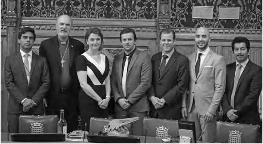
Schirmmacher und Baronin Berridge mit den Leitern der Delegation von Parlamentariern aus fünf lateinamerikanischen Ländern.

Staatsgewalt, um andere Religionen und andere Konfessionen innerhalb des Christentums zu bekämpfen, während sich heute nur noch eine winzige Minderheit dafür ausspricht.