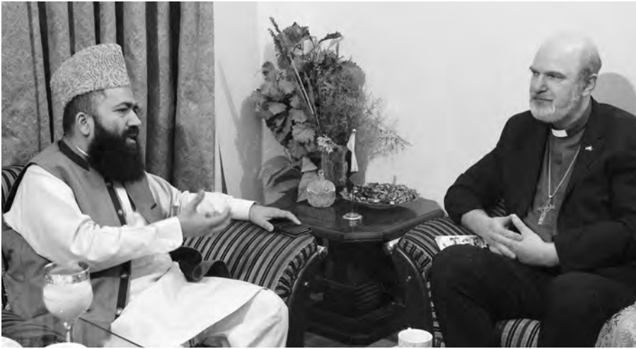
Großmufti Azad und Bischof Schirmmacher im Gespräch © BQ / Warnecke.

kistan. Außerdem hielten sie Gastvorlesungen, interviewten Sklaven in einer Ziegelei und hielten ein Seminar über Menschenrechte zusammen mit der pakistanischen Rechtsanwaltsvereinigung „The Voice“ ab.