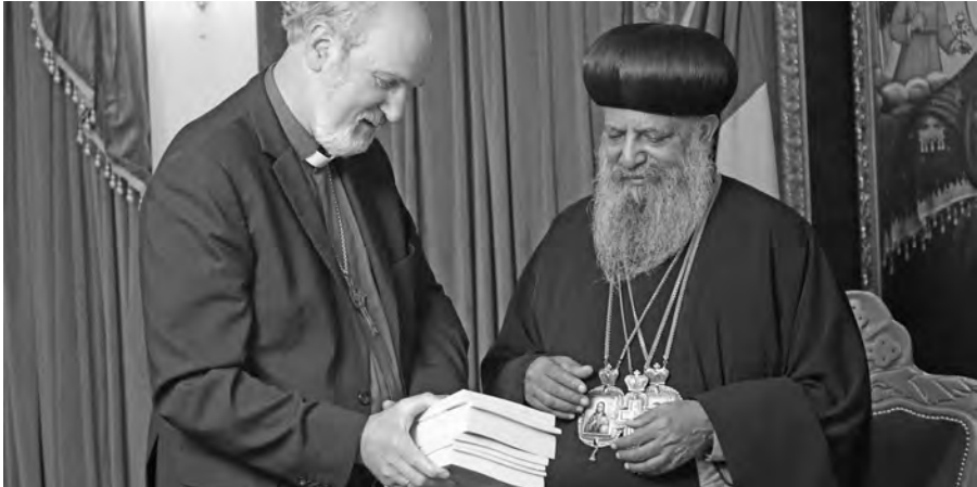
Foto: Übergabe des Jahrbuchs und von Literatur zur Religionsfreiheit an Seine Heiligkeit Patriarch Abuna Matias der Äthiopisch-Orthodoxen Kirche an dessen Amtssitz in Adis Abeba.

(Teil 2 wird hier nicht abgedruckt, da er bereits im Jahrbuch 2017 erschien.)