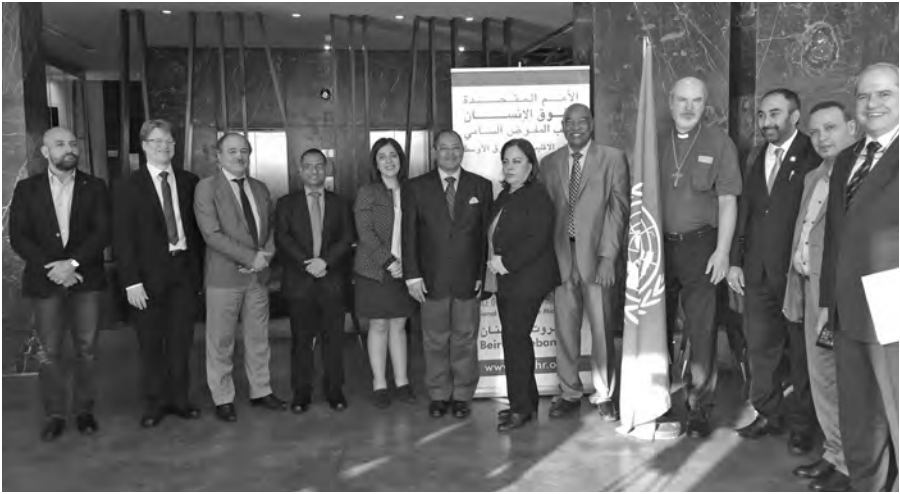
Delegierte des OHCHR-Symposiums in Beirut © BQ / Warnecke.

wertigkeit der Geschlechter sowie von Minderheitenrechten, die Unterdrückung kritischer Stimmen zu unterlassen und sich mit Kindern und Jugendlichen auszutauschen.