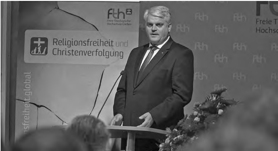
Markus Grübel bei seinem Vortrag zur Eröffnung der Professur für Religionsfreiheit an der Freien Theologischen Hochschule in Gießen.

Es ist eine besondere Chance, dass der Beauftragte für weltweite Religionsfreiheit im BMZ angesiedelt wurde. Nicht nur, weil CDU und CSU die Parteien sind, die das Thema Religionsfreiheit am frühesten und konsequentesten aufgegriffen haben. Die Politik des BMZ orientiert sich an den 17 Zielen für nachhaltige Entwicklung, die die Vereinten Nationen 2015 vereinbart haben. Diese Agenda 2030 baut im BMZ ausdrücklich auch auf das Potenzial der Religionen, zu einer friedlichen Entwicklung beizutragen. Dem BMZ geht es dabei darum, die Zusammenarbeit mit religiösen Akteuren auszubauen, Friedensstifter stark zu machen, den interreligiösen Dialog zu fördern und Diskriminierung und religiösem Hass entgegenzuwirken. Denn so viel ist klar: Jeder Einsatz für Religionsfreiheit und Menschenrechte stärkt den Frieden – und mindert Fluchtursachen. Erfreulicherweise hat das Auswärtige Amt einen Arbeitsstab zur Friedensverantwortung der Religionen eingerichtet.